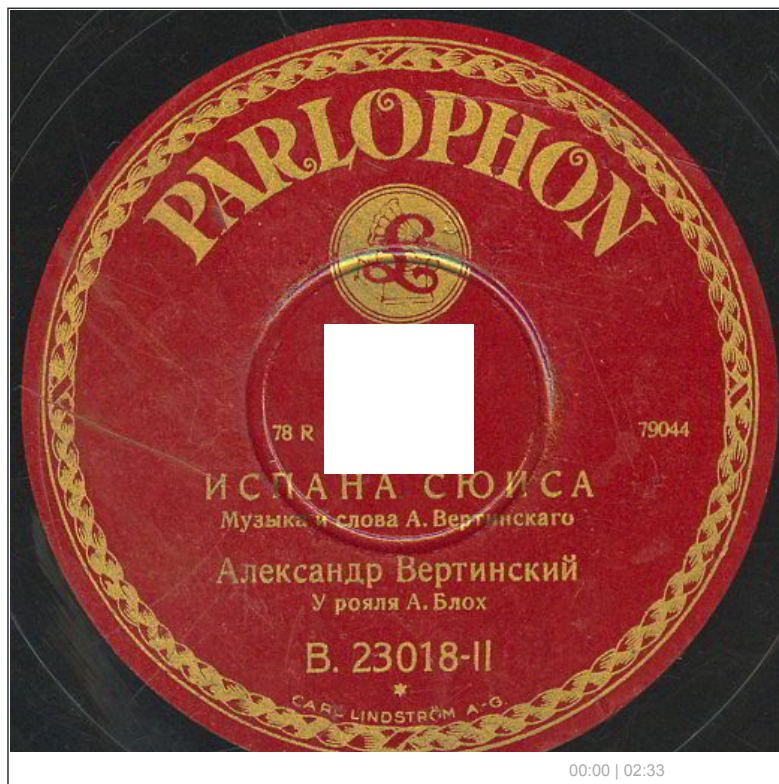
«Испано-Сюиза» Вертинского. Грампластинка 1930 года Parlophon-79044

Этот речитатив Александра Вертинского едва ли можно отнести к числу самых известных его произведений. «Испана Сюиса» — так написано на этикетке старой грампластинки: