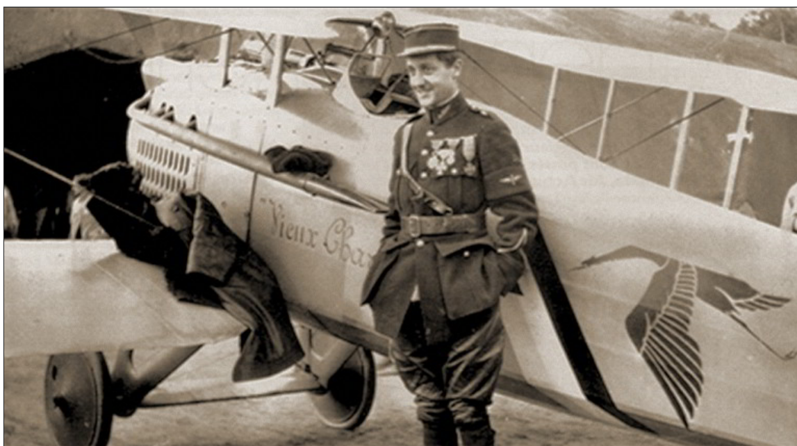
Жорж Гинемер позирует возле своего самолёта Spad VII. На всех самолётах Гинемера, помимо изображения аиста, имелась также отличительная надпись «Vieux Charles» — «Старина Шарль» (сентябрь 1916 года)

Летающий аист на фюзеляже являлся во время войны опознавательным знаком легендарной эскадрильи «La Cigogne» («Аист»), которой в 1917 году командовал лучший французский лётчик-ас Жорж Гинемер (так у нас по традиции произносится фамилия Guynemer).