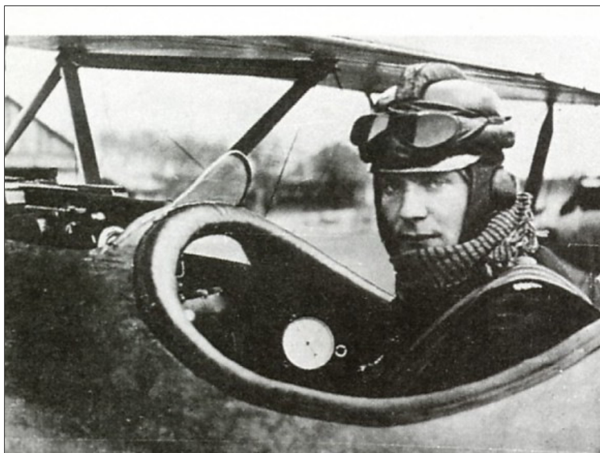
Немецкий ас Герман Геринг (22 сбитых самолёта) в кабине своего истребителя

Война подходила к концу. В конце сентября 1918 года Эрнст Удет одержал свои последние в этой войне победы. Из книги воспоминаний «Жизнь лётчика», глава под названием «Конец»: