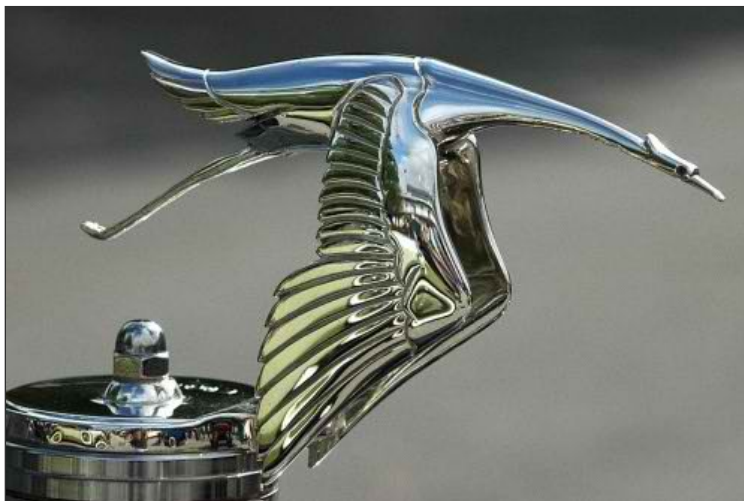
Эмблема «Испано-Сюизы» — аист на крышке радиатора

Впрочем, в глазах обывателей самым непосредственным и наглядным доказательством связи автомобилей «Испано-Сюизы» с авиацией была фигурка летящего аиста на крышке радиатора.