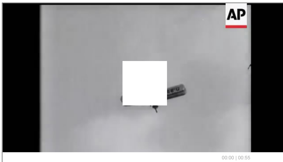
Кинохроника: показательное выступление Эрнста Удета

Лётное мастерство Удета можно оценить по сохранившимся кадрам кинохроники: