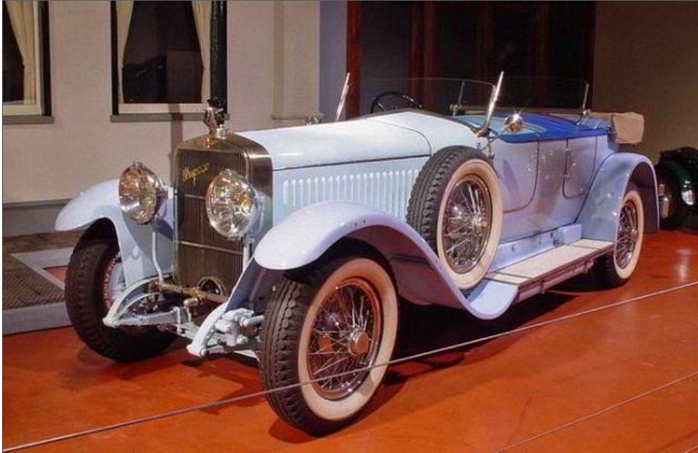
«Испано-Сюиза» Н6 — самый престижный в 20-е годы автомобиль представительского класса

Как пояснил позднее Вертинский, он написал «песенку-шарж на западную киноактрису» , которую он иронически сравнивает с Весной на одноимённой картине Ботичелли. Утомлённая славой и богатыми поклонниками, надменная и капризная, она живёт, словно в «кинотумане», в беспечали и в роскоши, бесконечно далёкая от реального мира звёздочка — и непременным атрибутом такой её жизни, по мнению Вертинского, и является её голубая «Испано-Сюиза»: